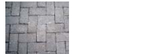
PAVÉS EN BÉTON