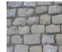
PAVÉS DE PIERRE