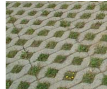
BÉTON - GAZON