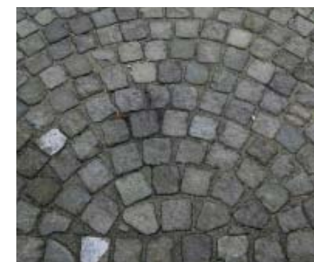
PAVÉS DE PIERRE DES ESPACES PUBLICS