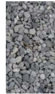
GRAVIER ET DOLOMIE

Notons qu'à l'avenir, les dispositions de la charte devront être intégrées dans les futures demandes de permis d'urbanisme. Rappelons que nul ne peut intervenir sur le domaine public.